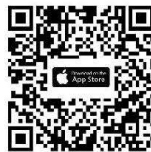
iOS iOS 14.5 ขึ้นไป