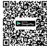
Android Android 8.0 ขึ้นไป