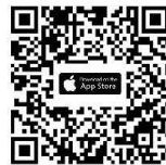
iOS iOS 14.5 ขึ้นไป