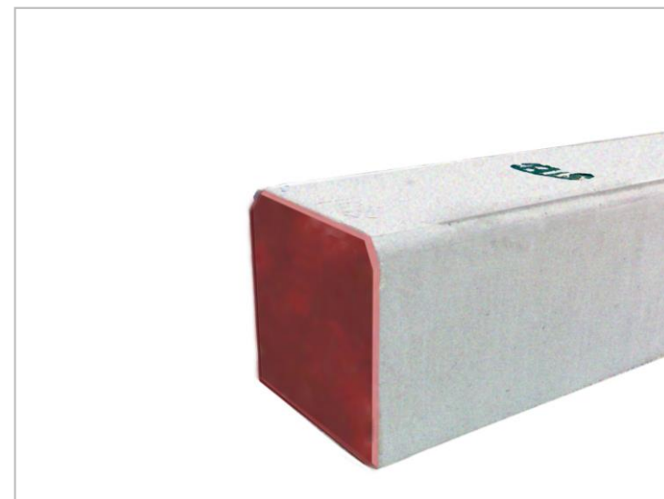
( SOLID SQUARE - SECTION )

เสาเข็มคอนกรีตเสริมเหล็กอัดแรงภาคตัดขวางรูปสี่เหลี่ยมจัตุรัสตัน